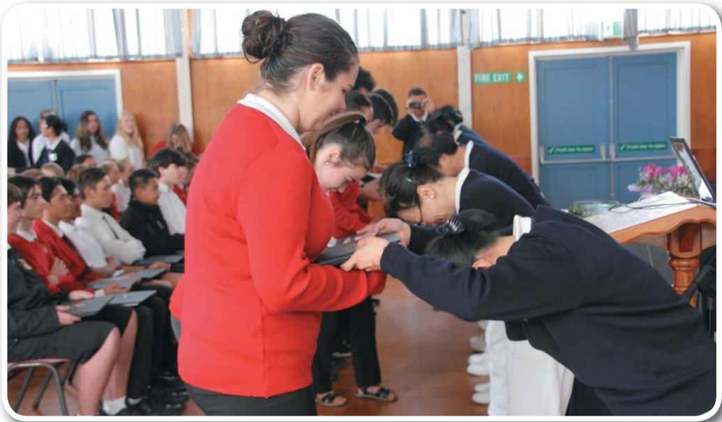
Tzu Chi donates 55 laptops and 3 TV's to Edgecumbe College.

五月二十八日早上五點，天未亮，城市都還在熟睡著，二十位慈濟人已穿上藍天白雲輕手輕腳的關上家裡的大門，準備前往分會集合。