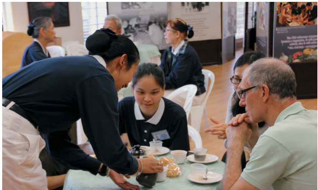
Hosting a tea party for our City Mission hot meal volunteers.