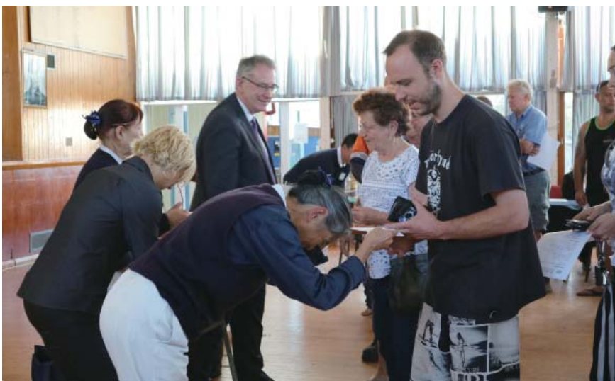
Volunteer hands out financial aid with sincere love.