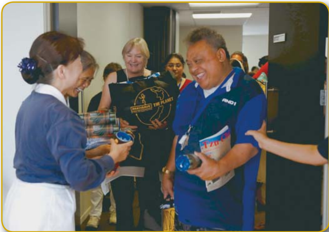
Handing out bamboo banks to flood victims.

敬的交到災民手上。災民心中的無助與憂傷，在這一時刻得到釋放，有人開心的笑、有人流下眼淚，他們的悲喜都讓志工感到萬分不捨。來自泰國的派敦朋手上