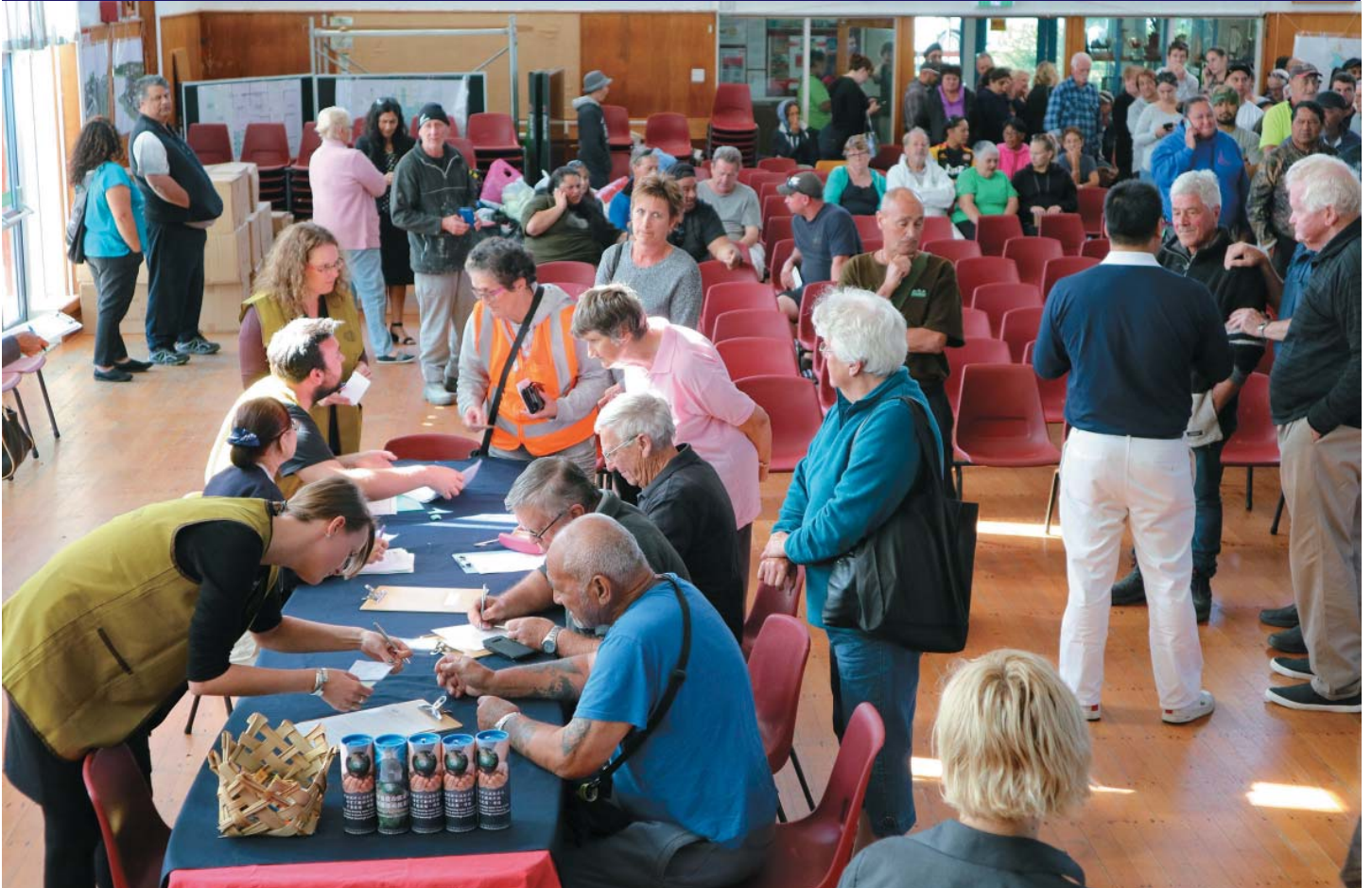
Edgecumbe disaster victims receive financial aid and comfort from Tzu Chi volunteers.

熱帶氣旋黛比 Cyclone Debbie 四月四日夾帶強風暴雨橫掃紐西蘭。連日的大雨，六日北島豐盛灣小鎮埃奇庫姆貝 Edgecumbe 旁的朗格泰基河 Rangitaiki River 潰堤，一千六百位居民緊急疏散撤離。