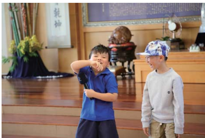
Children perform a play to demonstrate saving water.

「不要再浪費水，如果每天都這樣，有一天你就沒水，就不行洗澡了！」小朋友用自己的語言，認真投入表演，其中陳謙小朋友逗趣演出慢吞吞洗澡的模樣，讓全場笑個不停。知足班的情境劇由鄭思琳師姊負責彩