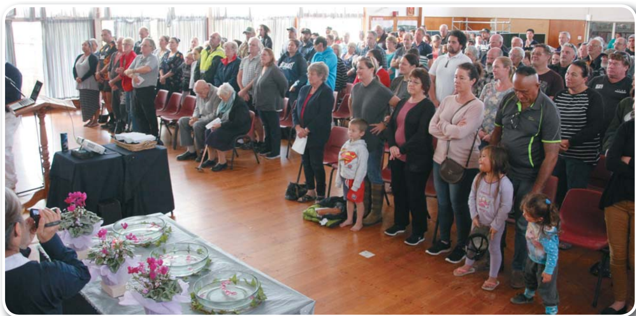
Blessing ceremony during Edgecumbe's second flood relief.

四月二十一日分會志工前往當地第一次發放現值卡二百戶，因政府評估工作仍持續進行中，沒在第一次發放名單的部份災民著急，人人需要這筆急難救助金解決家中許多的問題。分會承諾只要政府評估告一段落，慈濟不會忘記他們的。