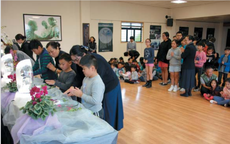
Students participate in Buddha Bathing Ceremony.