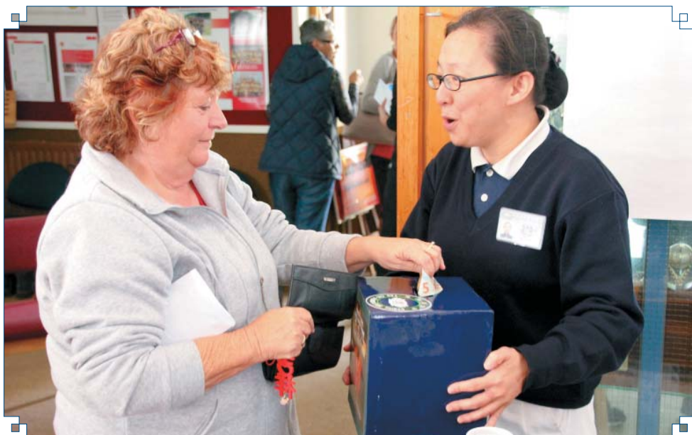
Local resident donates back to help others in need.