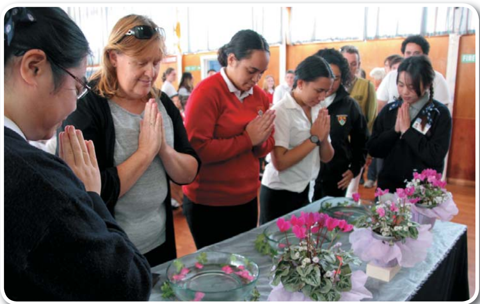
Teachers and students pray for peace to our land.