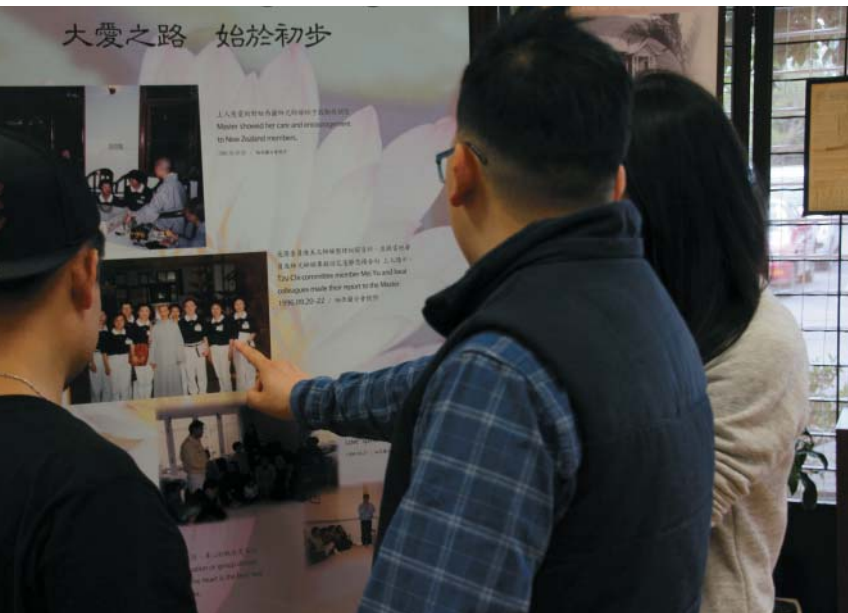
Young volunteers learn to know more about Tzu Chi.