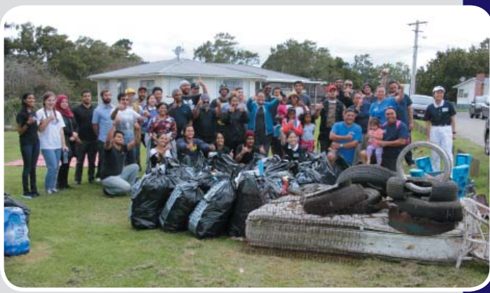
Interfaith joins Tzu Chi in park clean up.