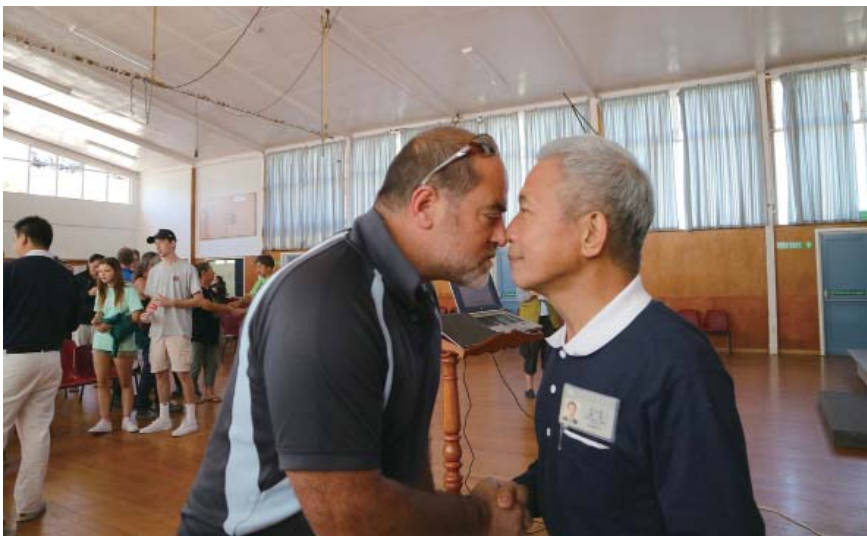
Recipient expresses gratitude with a Hongi.

「Kia Kaha」毛利語「要堅強」，災民和志工擊掌互相加油打氣，水災中失去生活了四十六年的家，理查神情黯然，志工緊握他的手，傳達關懷之意。「我愛你們」災民收到現值卡不可置信的激動