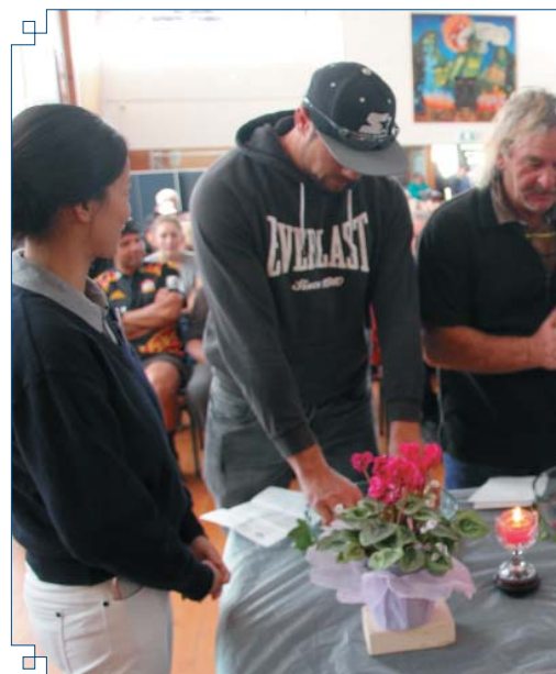
Praying from all cultures