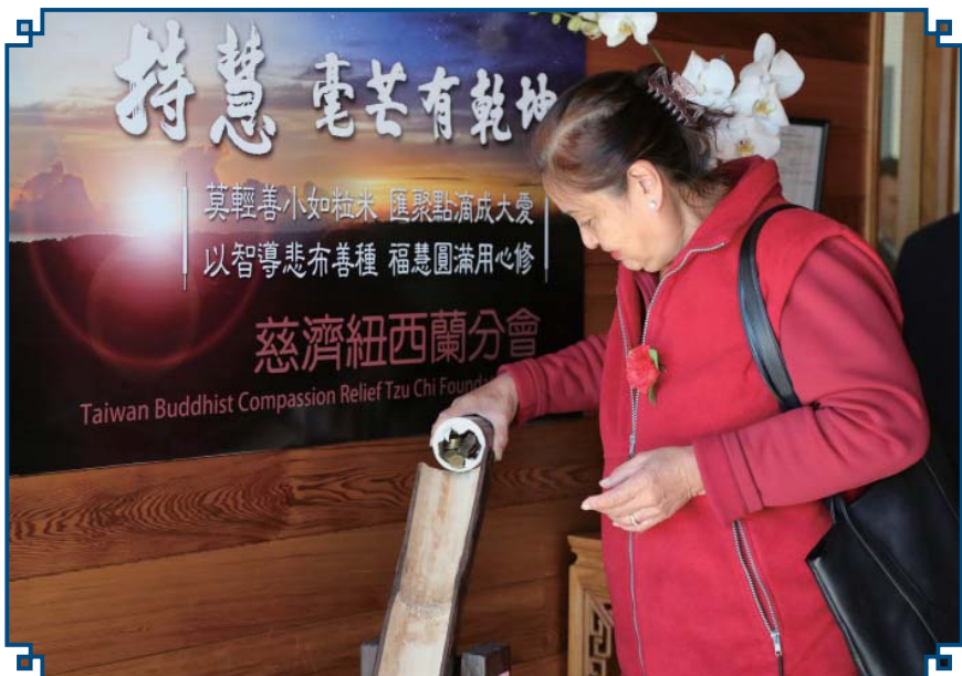
A little money goes a long way.