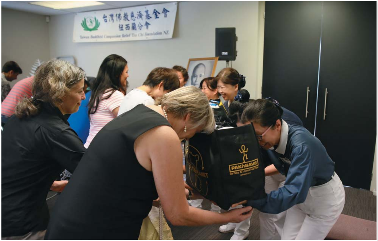
Auckland flood victims receive food parcel and prezzy card from volunteers.