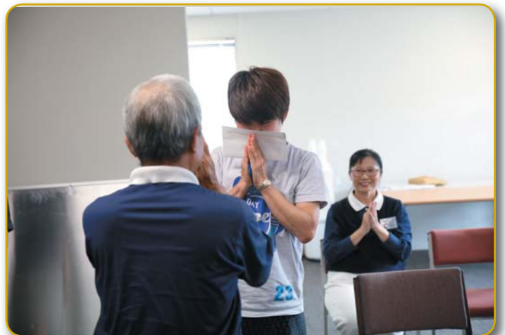
Recipient shows gratitude towards Tzu Chi.