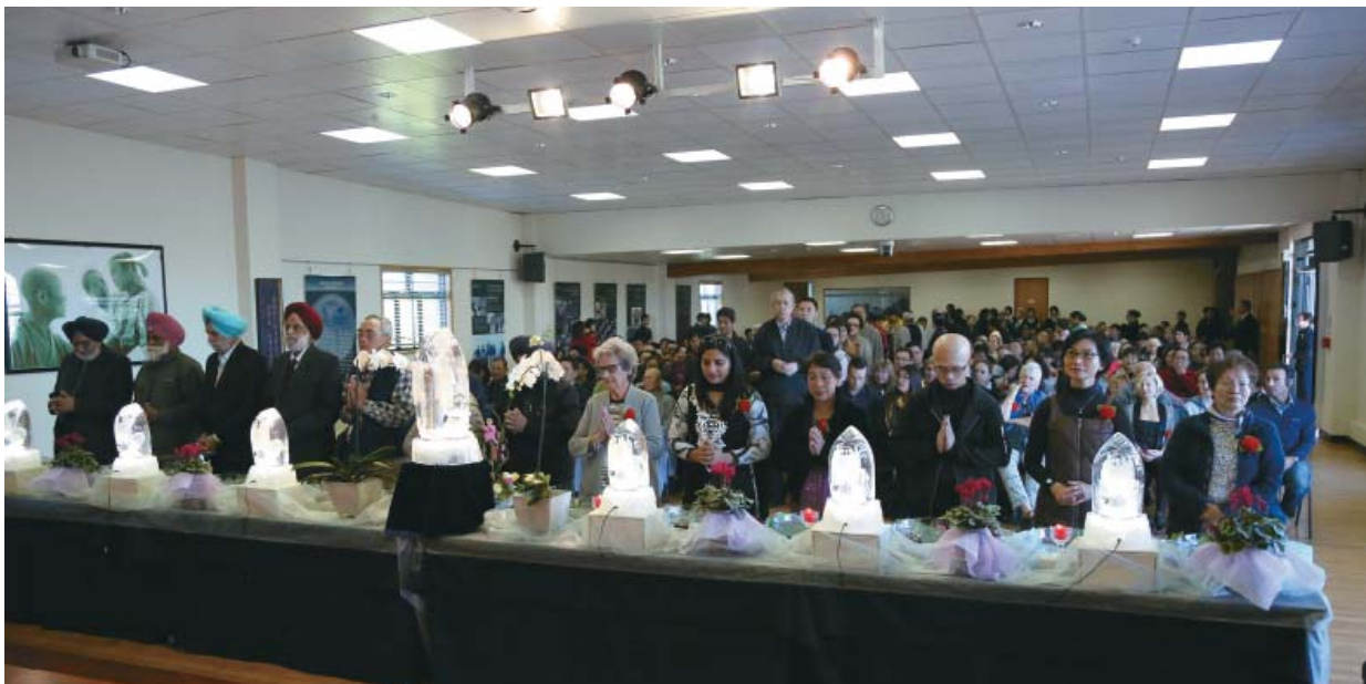
390 people in participation at the 2017 Buddha Bathing Ceremony.

清晨的陽光普照大地，今天五月十四日是「佛誕節、母親節、全球慈濟日」三節合一的大好日子，也是充滿感恩的時刻。分會早在幾週前，大家陸續的都在為這歡喜日子作準備，環境打掃、佈置、音控、彩排、各區志工總動員。