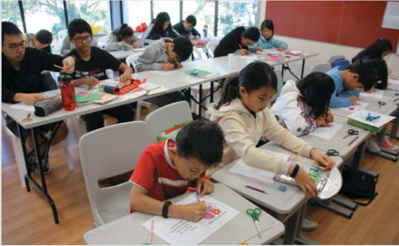
Chinese class students make Mother's Day card to show their love.

中年級的班級則全神貫注學習折紙藝術，一朵朵盛開的花送給媽媽表心意。也有人選擇製作母親節卡片，內向的小男孩把平日不好意思對媽媽說的話，全寫在卡片上。「母親節快樂」的卡片完成了，張杏蜜老師鼓勵學生，愛要大聲說出來喔！